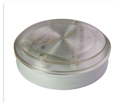
Исполнение корпуса 2 рекомендуется при скрытом монтаже проводки

Цветовая температура светодиодов в серийных светильниках - 4000 К (нейтральный белый). Под заказ производятся светильники с цветовой температурой светодиодов - 3000 К (тёплый белый) и 5000 К (холодный белый).