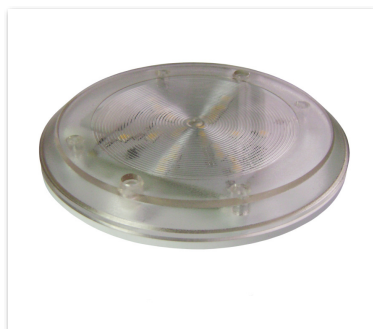
Исполнение корпуса 1 рекомендуется при наружном монтаже проводки